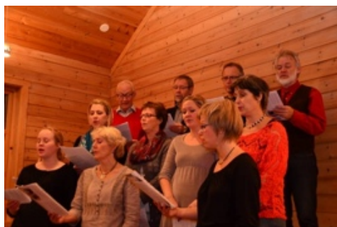
Fognakoret i aksjon.